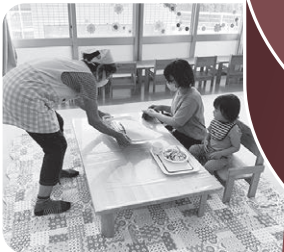
ぴよんぴよんカフェ