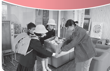
箱募金活動 (津田小学校)